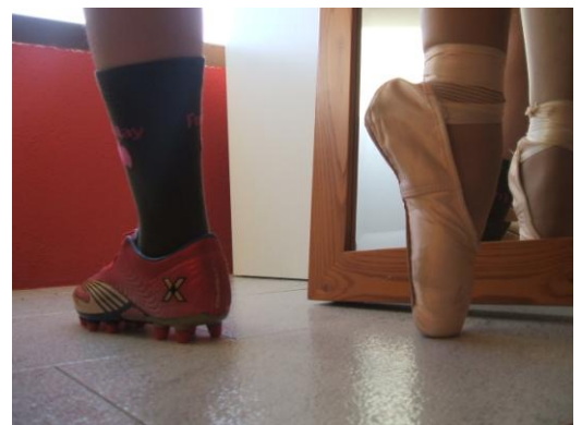
Título: ¿Por qué no? / Autora: Lucía Valea. Foto ganadora de un concurso de NONP.

https://www.asturias.es/portal/site/astursalud/menuitem.2d7ff2df00b62567dbdbf51020688a0c/?vgnnextoid=21d9db0c3da3e310VgnVCM10000098030a0aRCRD