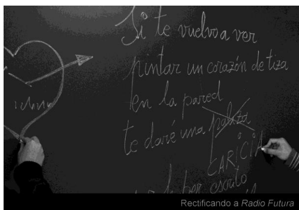
Rectificando a Radio Futura

*Con datos de plantilla a 1 de enero de 2016, incluyendo matronas.