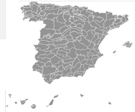
Nivel de alerta por provincias y zonas isoclimáticas