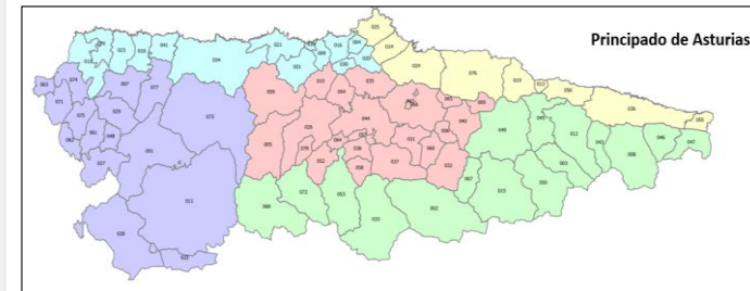
Distribución de las zonas isoclimáticas de Asturias