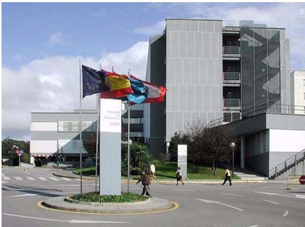
HUCAB (Hospital Universitario de Cabueñes- Gijón)

El Hospital Universitario de Cabueñes, ubicado en Gijón, es el hospital de referencia del Área V y el Área VI (Arriondas) en esta especialidad. Tiene acreditadas 3 plazas para Especialistas en Formación. En él tienen lugar alrededor de 1200 partos anuales. Alberga la Unidad Docente de enfermeros/as especialistas en obstetricia y ginecología del Principado de Asturias. Todos los centros de salud del área V están acreditados para la docencia.