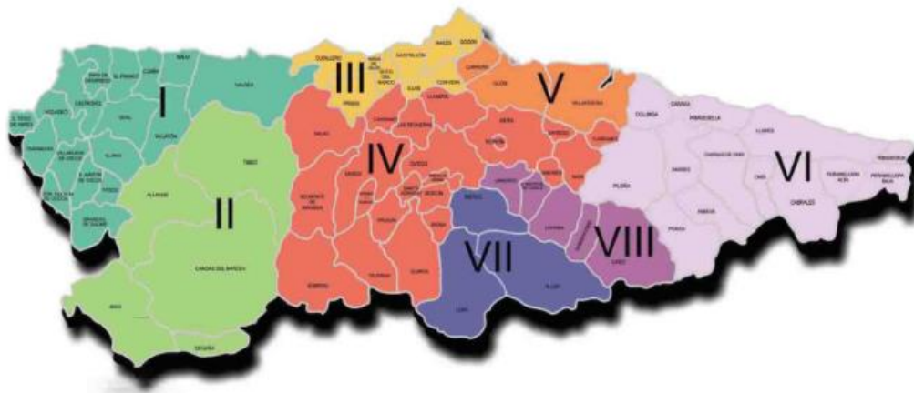
Ubicación de las Áreas Sanitarias del Principado de Asturias